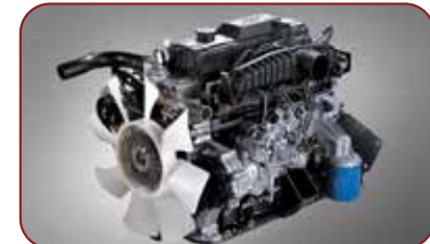
J2 Engine 2700cc