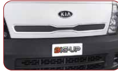
Desain Front Lid Lebih Modern