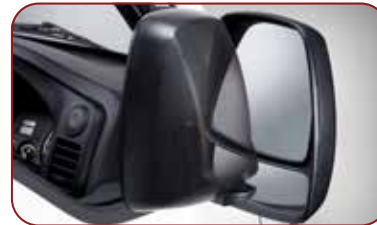
Outside Mirror Assist & Main Mirror Sighting