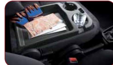
Konsol Sandaran Tangan