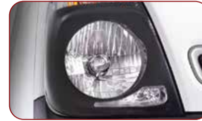
Head Lamp dengan Black Bezel